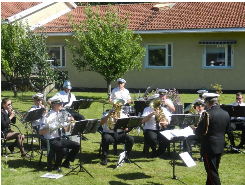
14 augusti fick Oasen besök av en estnisk blåsorkester som uppträdde vid innergården.

En frivillig resursperson har besökt avdelningarna ca två gånger i veckan under hela året och erbjudit bingospel, högläsning, pepparkaksbak samt utepromenader.