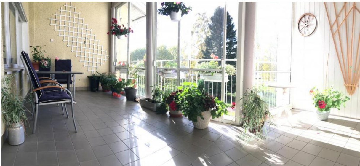
Under sommarhalvåret har balkongen fyllts av gröna växter, blommor och grönsaker.

Inomhusmiljön har förbättrats under året genom nya textilier, växter och tavlor. Allt detta tillsammans har bidragit till att miljön för de boende är mer estetiskt tilltalande och därmed ökar välbefinnandet på avdelning Pellas.