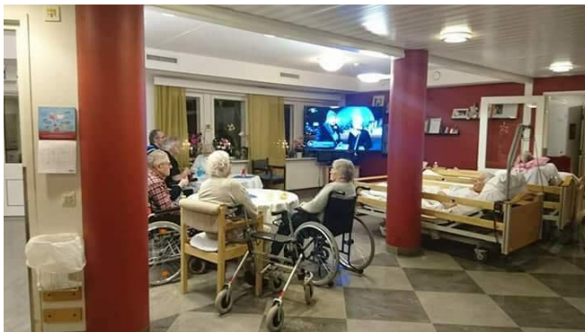
En TV, som sedan köptes in, hyrdes inför presidentbalen. En lyckad kväll med cider och chips.

På sommaren åkte personal och boende på Mattas vid ett tillfälle på café-besök till Club Marin i Östra hamnen. Kvällstid håller avdelningens närvårdare i mån av tid sångstunder, frågesporter eller bingo.