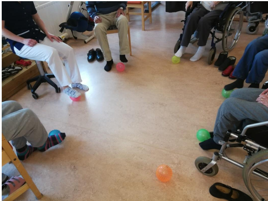
Under 2017 ledde fysioterapin sittgymnastik 1 gång i veckan per avdelning. Utöver detta hölls lättare aktiverande gruppaktiviteter på avdelningarna 1 gång i veckan.

Vardagar erhålls fysioterapi antingen i grupp gymnastik eller genom individuell träning. Regelbunden dialog sker mellan personal och husets fysioterapeuter. Fysioterapin stöder vårdpersonalen i ett aktiverande och rehabiliterande arbetssätt.