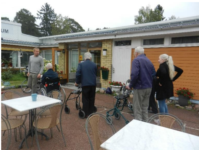
Under skördfestdagarna gjordes en utflykt till Ålands fotografiska museum.

Utevistelse var prioriterad under våren, sommaren och hösten. Alla boenden erbjuds regelbundet utevistelser. Boendes önskan att vistas ute avtar vid lägre utetemperatur, regn och blåst.